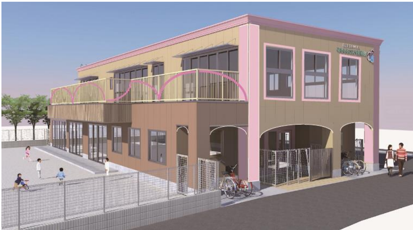
園舎見取り図 (平成30年度2月完成予定)