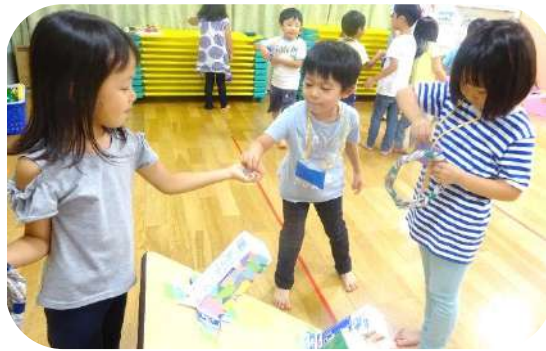
ごっこ遊びを通して社会性を学びます(武蔵境)

私は現在75歳ですが、人生で初めて罰を与える経験をしました。Aさんについては他にも不行届が多く、他の管理職の職員から「理事長はAさんに対し甘すぎる」との批判を受けていました。よくよく考え、教育的罰なら「是」と決断し、行った処分でした。とは言え決して気分は良くありませんでした。