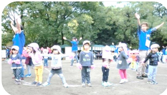
昨年の運動会の様子。今年も頑張ります！

昨年はお天気に恵まれず、出来なかった種目がありましたが、今年度は全ての遊戯や競技が出来るように祈りたいと思います。これか